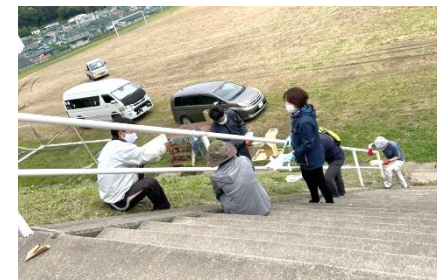
ボランティア活動(環境整備)の様子