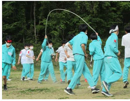
みんなでカウント, ハの字跳び