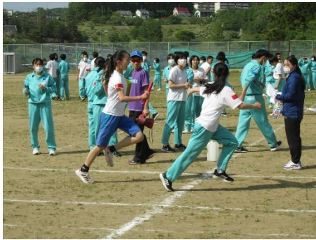
後は頼んだ!全員リレー