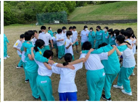
優勝するぞ!みんなで円陣

5月1日(月), 本校校庭において, 生徒会主催の第1回スポーツ大会が行われました。