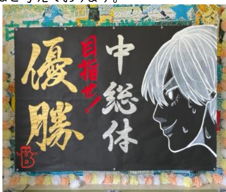
総合文化部の生徒が作成したメッセージ

4月21日木曜日、ちょうど見ごろを迎えた蔵王の桜を見ながら、1学年生徒、職員で蔵王少年自然の家に行って参りました。「仲間づくり」を主なテーマとし、午前は、みやぎアドベンチャープログラム、午後は5名の講師を招いてp4cを実施し、思いやりについて自分の思いや周りの人の思いに耳を傾けられた時間となりました。また、昼食は防災食としてポリナポリタン、ホットサンドづくりに取り組みました。賑やかに、新しい発見のあった食事になりました。この行事を良い機会とし、仲間を大切にできる学年、学校を形作っていかればと考えております。