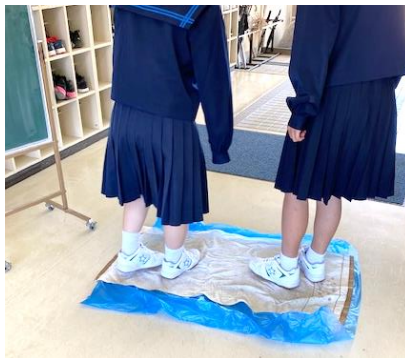
消毒液を染み込ませたマット。 毎日洗濯して使用しています。