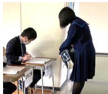
教室に入る前に健康観察をします。