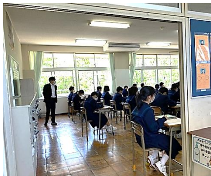
常時、窓を開けて換気をしています。