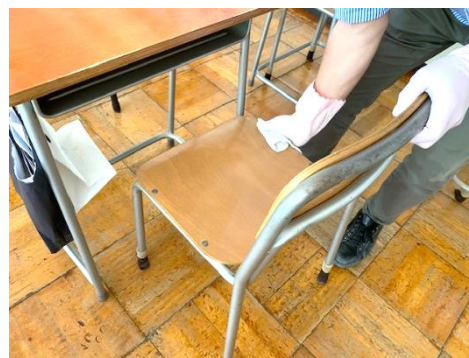
生徒の下校後に机や椅子、扉なども 消毒しています。