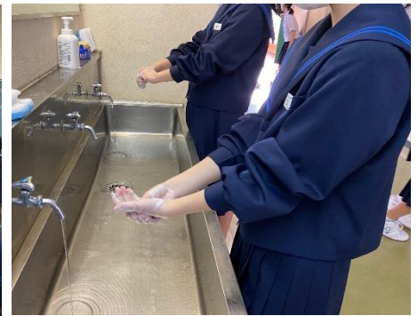
こまめに手洗いをしています

学習については、前回の学校だよりでお知らせしたように、様々な点を検討し、計画を立てて学習を進めています。本日、各学年の「令和2年度学習計画」を配布しましたので、保護者の皆様もご確認ください。今後も状況によっては、さらに変更があるかもしれませんが、その際には、再度お知らせいたします。