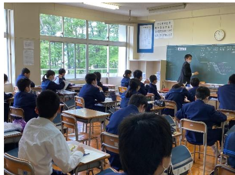
授業にしっかり臨む生徒たちは 東中学校の自慢です