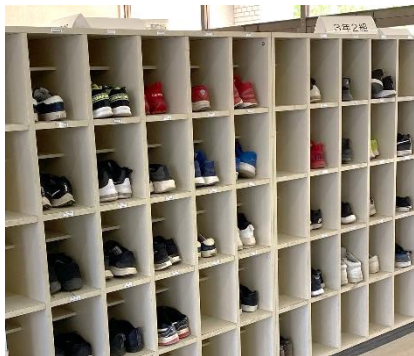
3年生の下駄箱は いつも清々しく揃っています

今週から学校が再開し、本格的に授業が始まりました。これまでの登校日で、学校再開に向けての準備を段階的に行ってきたためか、たいへん落ち着いた雰囲気です。授業をしっかり受ける東中生たちは、学校の自慢です。今年度、東中では、学校全体で時間のけじめや明るいあいさつなど、社会に通用する資質を育てていきます。生徒たちにとっては、かけがえのない中学校生活です。ご家庭や地域の皆様にもご協力いただきながら、新しい生活様式での学校生活を充実させていきたいと思っています。